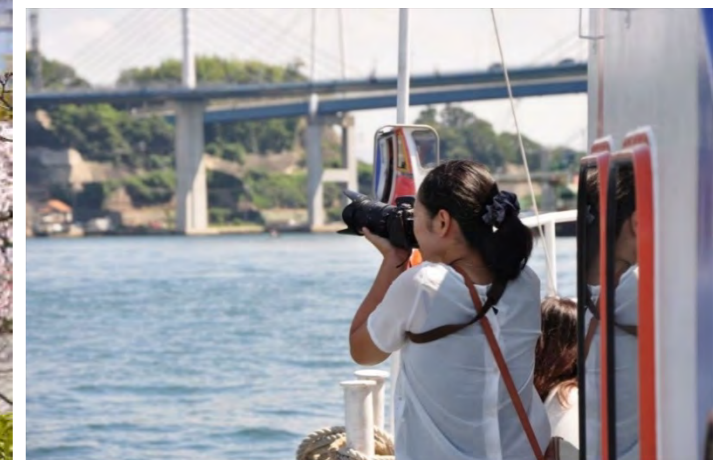
▼写真を通じて尾道の魅力を伝える『おのみちフォトゼミ』