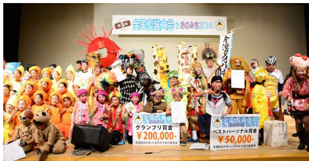
▲尾道を仮装で盛り上げる『全国仮装大会 in おのみち』

広島県、愛媛県の沿岸部を舞台としたイベント『瀬戸内しまのわ2014』で各地に多くの観光客が訪れました。こうした広域にわたるイベントを通じて改めて感じたのは、“情報の共有化”の重要性。そこで尾道観光協会では、事業内容や会員紹介、観光に関する知識や情報を発信する会報誌『おのみち』を新しく発行し、情報の共有化を図ります。