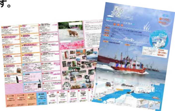
▲おのたび旅行社の商品「おのみちスイーツ・クーポン」(左)と「尾道水道クルーズ」(右)。尾道での回遊性を高め、滞在時間延長を目的に企画し、尾道を隅々まで満喫できる内容となっています。

7月から10月にかけて、神戸、大阪、倉敷、福岡、広島、山口など、全49社の旅行会社を訪問。旅行商品の企画担当者と直接交渉し、おのたび旅行社の商品紹介や尾道の魅力を伝えました。なかには、実際におのたび旅行社の商品を行程に組み込んでいただいた旅行会社もあります。また、これまで尾道への旅行を企画したことがない旅行会社からも、しまなみ海道サイクリングの問い合わせが入るなど、新たに注目されています。