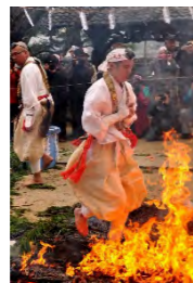
紫燈護摩(火渡り神事)