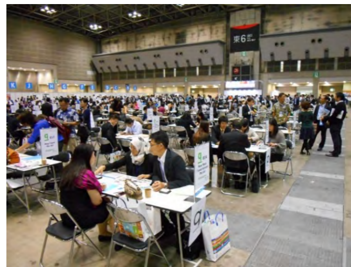
▲おのなび旅行社として出展した『VISIT JAPAN トラベルマート2014』