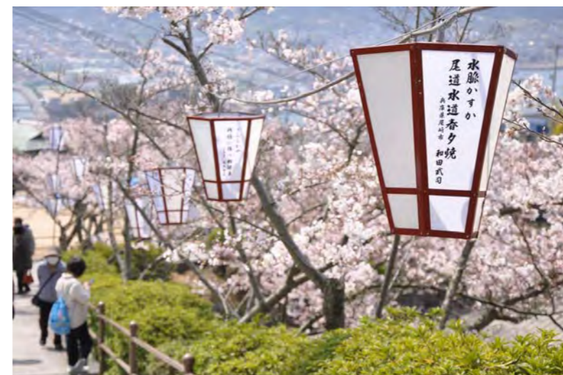
▲千光寺公園を俳句のぼんぼりで彩る『おのみち俳句まつり』

広島県、愛媛県の沿岸部を舞台としたイベント『瀬戸内しまのわ2014』で各地に多くの観光客が訪れました。こうした広域にわたるイベントを通じて改めて感じたのは、“情報の共有化”の重要性。そこで尾道観光協会では、事業内容や会員紹介、観光に関する知識や情報を発信する会報誌『おのみち』を新しく発行し、情報の共有化を図ります。