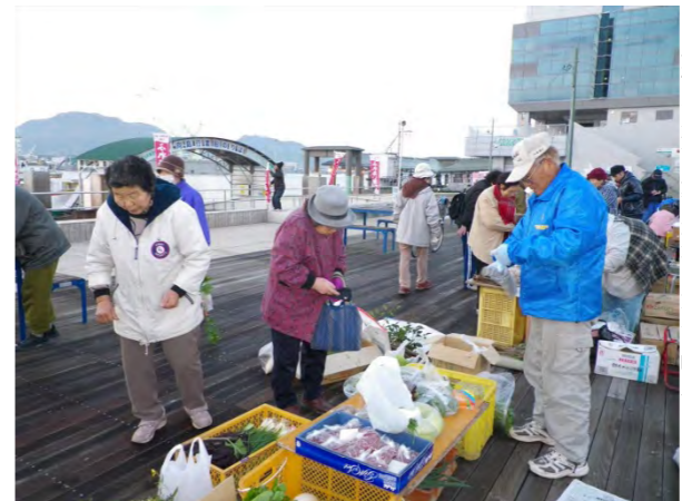
▲ふれあい朝市(毎月第一・第三日曜日)