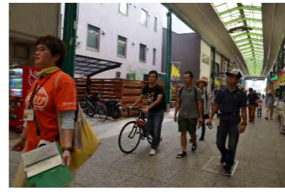
▲街歩きツアーの様子。

そんな不安解消のお役に立てるのが、当協会の『おのたび旅行社』です。「しまなみ海道でガイド付きのサイクリングツアーを組みたい」「尾道を半日で楽しめるツアーを組みたい」など、尾道の旅行のことは何でもおまかせ。旅行会社の受入やサイクリングツアーを企画し、ガイドブックには書いていない見どころを直接伝えることで、何度も訪れたいくなるきっかけづくりへとつなげています。