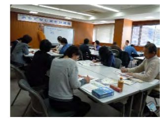
▲外国語講座の様子。

『自分は言葉が通じないから』と距離をとっている人は、少しだけ勇気を出してみませんか。『また来たい』と思ってもらえる「おもてなしの心」を外国語講座で磨いてみてはいかがでしょうか。