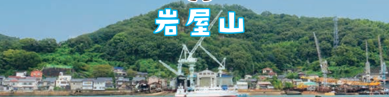
尾道水道と岩屋山