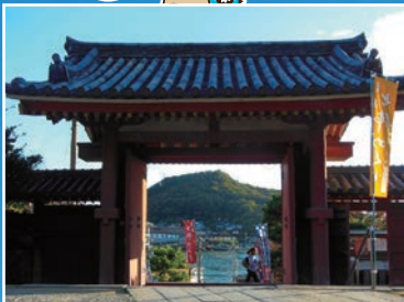
浄土寺山門からの岩屋山