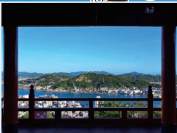
千光寺本堂からの岩屋山