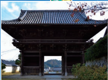
西國寺仁王門からの岩屋山