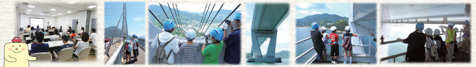
まずはボクと一緒に橋の勉強♪