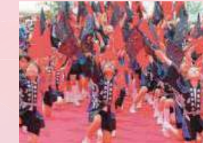
ええじゃんSANSA・がり 向島中央小学校