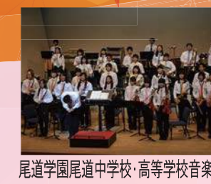
尾道学園尾道中学校・高等学校音楽部