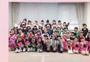
Kids ダンス スタジオship Bon declec