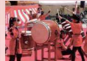
高見山太鼓 高見小学校