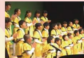
三幸音頭 三幸小学校