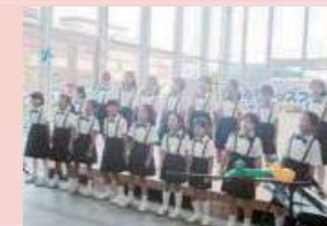
グリーンハーモニー 向島中央小学校