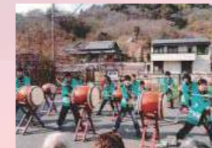
有道子ども龍王太鼓 有道郷土芸能保存会