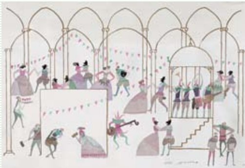
「繪本 シェイクスピア劇場」より 「から騒ぎ (Much Ado About Nothing)」

本展は平成13(2001)年に故郷の津和野に開館した津和野町立安野光雅美術館の協力を得て、素朴な草花や懐かしい童謡をテーマに描いた作品などの親しみやすいシリーズから、シェイクスピアや忠臣蔵といった文学をテーマとした作品など約100点を展示し、その魅力を幅広くご紹介します。