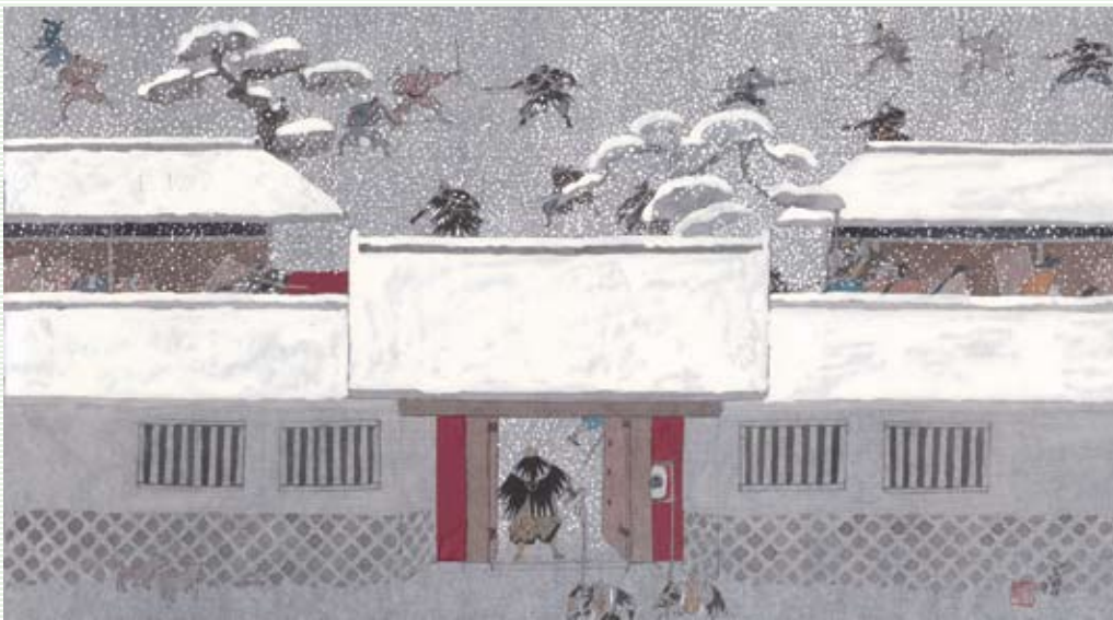
「繪本 仮名手本忠臣蔵」より(十一段目)「討入りの場」 ©空想工房