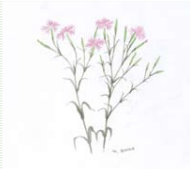
「みちの辺の花」より「かわらなでこ」 ©空想工房