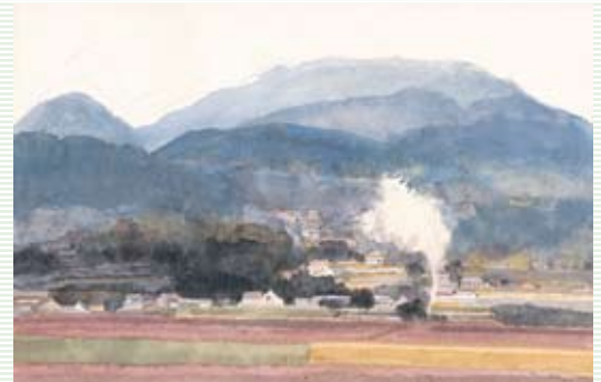
「日本の原風景」より「広島県・三次の棚田をたずねて」 ©空想工房