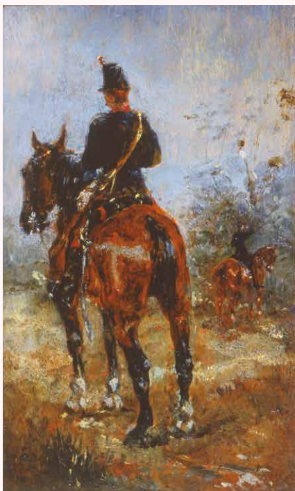
《馬上の二人の兵士》16-17歳