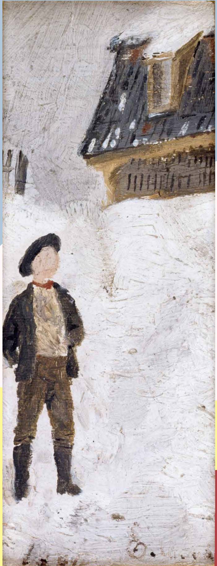
《雪景色の中の少年》エドヴァルド・ムンク、18歳