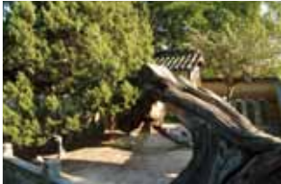
光明坊の県天然記念物「イブキヤクシ」