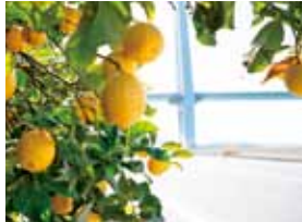
レモン谷から望む多々羅大橋