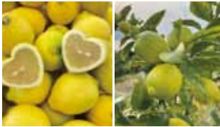
せとだエコレモン® グリーンレモン