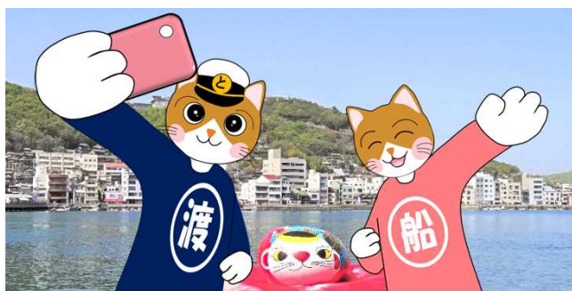
航海の安全を祈る 福石猫(ふくいしねこ)との記念撮影(※3)