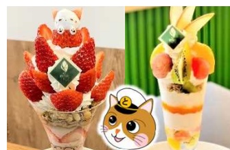
贅沢なフルーツパフェ(※7)

(※3) 福石猫は 広島県尾道市を拠点として活動する芸術家 園山春二氏によって生み出される丸い石に描かれた猫です。日本海等の荒波にもまれて丸くなった石を塩抜きし、特殊な絵の具で重ね塗りを行い、地元の良神社でお祓いを受けた後、晴れて福石猫になります。