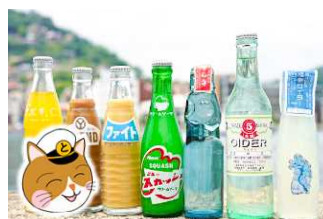
レトロで美味しいサイダー(※6)