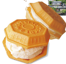
尾道の 絶品スイーツ!