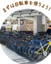
まずは自転車を借りよう！