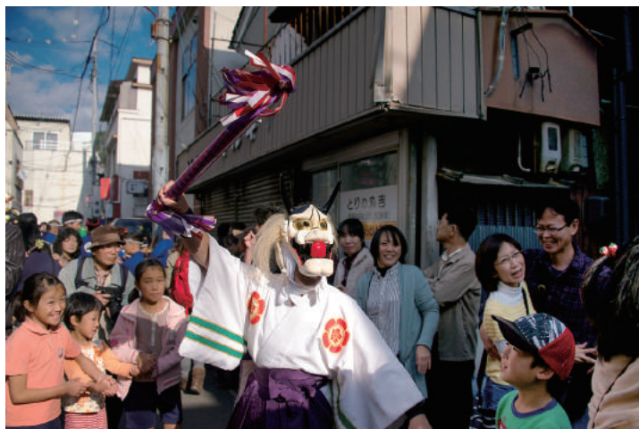
「ベッチャー祭り」

「おのなびフォトゼミ」は尾道観光協会ホームページ「おのなび」がきっかけになり作られた写真ゼミ。1年を通して尾道やその周辺の風景や祭り、人々の暮らしなどを個人的なゼミ生たちが感性のまま切り撮りました。お陰様で、おのな美展は今年で10年目を迎えます。脈々と受け継がれてきた日常や出会い、贅沢な故郷の風景を、この作品展を通し見つめ直していただけたら幸いです。