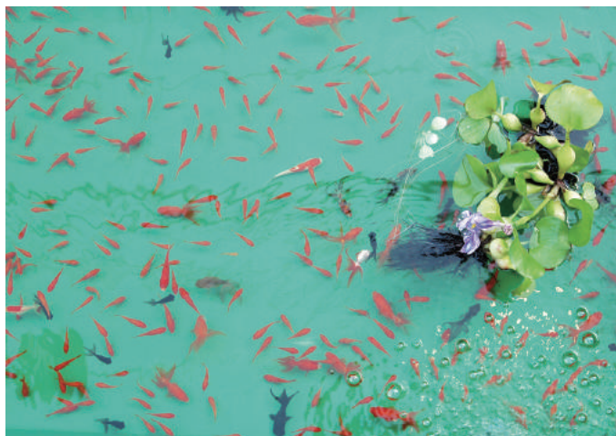
「水尾町の水祭り」