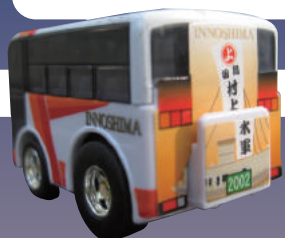
※写真は因の島バス チョロQです。