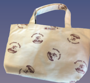
※写真はミニトートです。

～日本遺産認定記念～ 村上海賊船デザイン ・ポーチ… 500円 ・ミニトート…1,000円