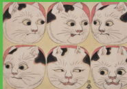
猫(引)「猫の恋心」1900年代 大正期