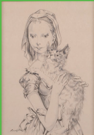
レオナルド・フジタ「猫を抱く少女」1950年 絵、水彩 © Fondation Fougita / ADAP, Paris & JASPAR, Tokyo, 2017 © GTFE