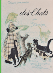
ステラン「des Chats」1998年 絵、リトグラフ