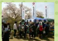
【はし作り・プラ版工作】