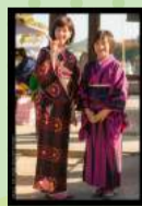
【着物で手しごと市】