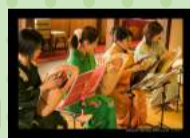
【竖琴ライアー演奏】

観音堂 着物で手しごと市 (レンタル着付け・福姫) その場で着物一式お選び下さい。お気軽に お着替え。町歩きもどうぞ 17:00 返却。 (事前のお問い合わせお気軽にお電話下さい)