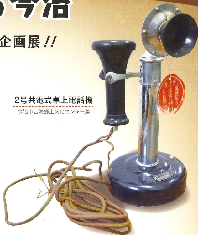
2号共電式卓上電話機