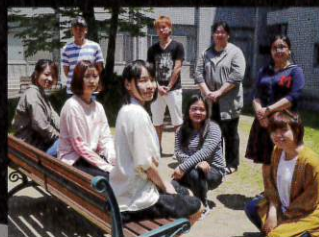
福山大学メディア・映像学科