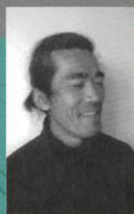
R a m o