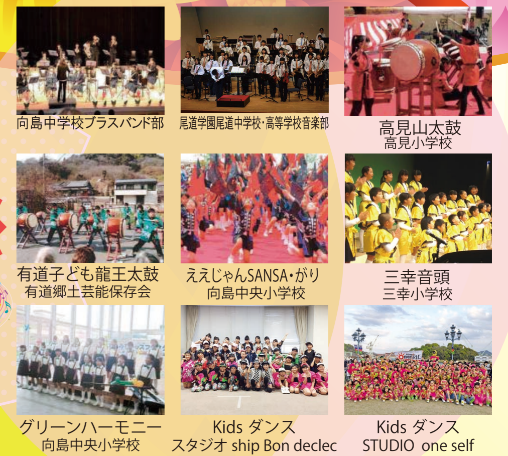
向島中学校 brassバンド部 尾道学園尾道中学校・高等学校音楽部 高見山太鼓 高見小学校 有道子ども龍王太鼓 有道郷土芸能保存会 ええじゃんSANSА・がり 向島中央小学校 三幸音頭 三幸小学校 グリーンハーモニー 向島中央小学校 Kids ダンス スタジオ ship Bon declec Kids ダンス STUDIO one self