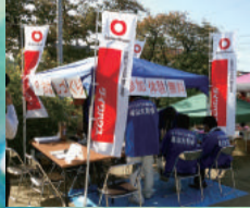
土曜日：もの作りコーナー&清掃協力