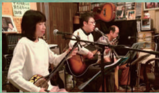
初登場：琉球シナチク

※『おのみち手しごと市』はエコロジーにも心がけております。 無駄なビニール袋が出ないように、お手数ですがお買い物袋 ご持参をお願いいたします。 ※全面禁煙です。 重要文化財ですので、禁煙にご協力をお願いいたします。 ※駐車場はございませんので、お近くの駐車場をご利用ください。 (駐車場に空きがなくなる場合がありますので、公共交通機関を 出来るだけご利用ください。)