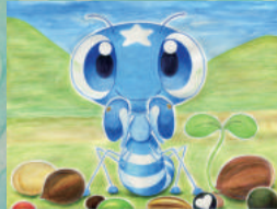
~風の紙芝居師~たけちゃん☆