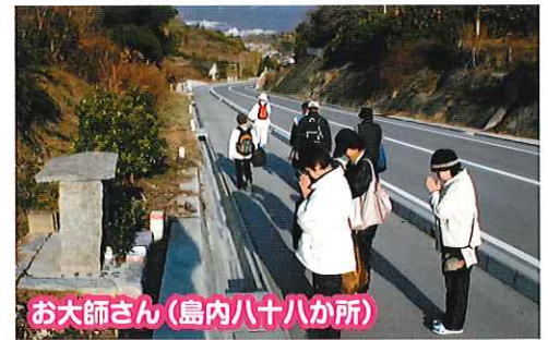
お大師さん(島内八十八か所)

向田港から徒歩約10分。小高い山の一面に桜の木が1,000本以上植えられており、満開の時期には桜色のトンネルができあがります。地域の運動により植樹が続けられ、「全国育樹活動コンクール」で林野庁長官賞を授与されました。