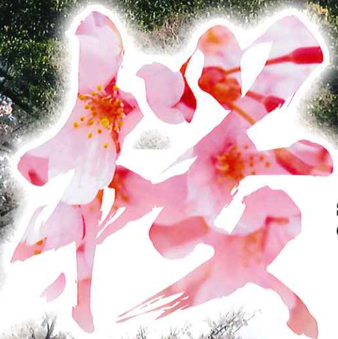
Sagishima Island Cherry Blossoms