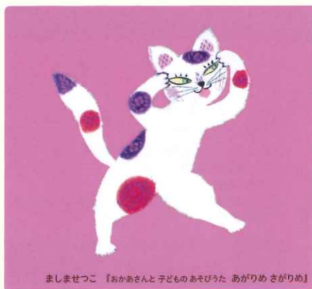
ましませつこ 『おかあさんと子どものあそびうた あがりめ さがりめ』