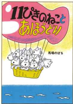
馬場のぼる 『11匹のねことあほうどり』

絵本の専門出版社こぐま社は、《こぐまちゃんえほん》シリーズや《11匹きのねこ》シリーズ、『わたしのワンピース』など多くのロングセラーを生み出してきました。