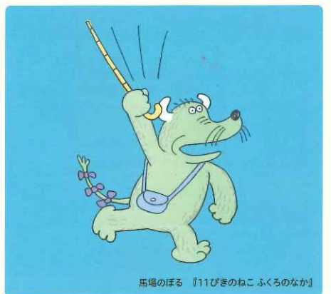
馬場のぼる 『11びきのねこ ふくろのなか』