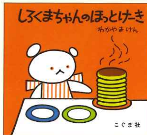
わかやまけん 『しろくまちゃんのほっとけぎ』