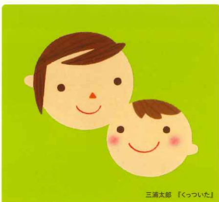
三浦太郎 『くっついた』