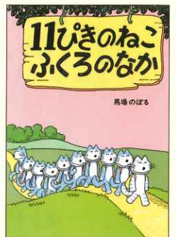
馬場のぼる 『11匹のねこ ふくろのなか』

子どもたちの心を魅了し、夢をはぐくんでくれた絵本。いつまでも心に残る絵本。絵本との新しい出会いに心おどった感動を、あらためて体験してください。