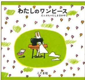
にしまきかやこ 『わたしのワンピース』