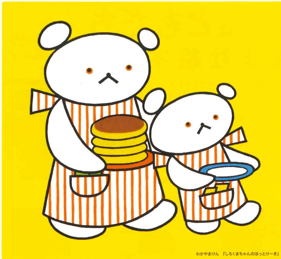
わかやまけん 『しろくまちゃんのほっとけーき』