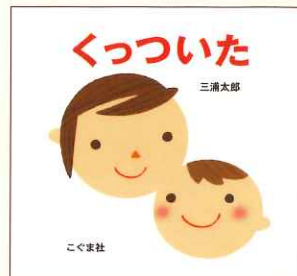
三浦太郎 『くっついた』