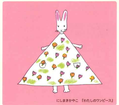
にしまさかやこ 『わたしのワンピース』