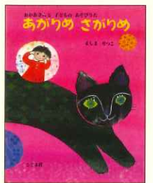
ましませつこ 『おかあさんと 子どもの あそびうた あがりめ さがりめ』