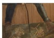
寺坂 早耶香 / 日本画

日々の中で心に留まったもの / ことを題材に、表現を模索しながら制作しています。