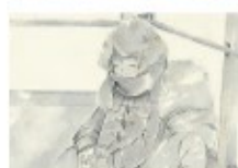
江上 菜季 / デザイン

日々の中で心に留まったもの / ことを題材に、表現を模索しながら制作しています。