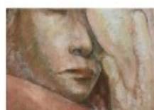
三浦 秀幸 / 油画