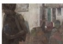
木崎 理葉 / 日本画