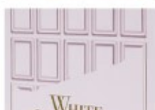
長谷川 さや / デザイン