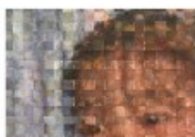
塔尾 茉莉 / 油画