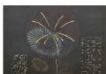
蓮井 彩乃 / 日本画