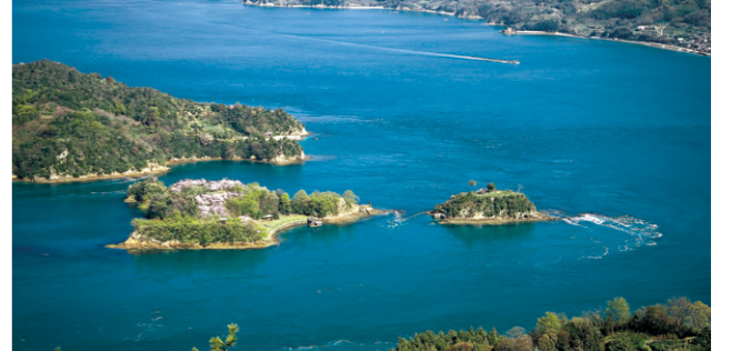
カレイ山展望台から臨む「能島」