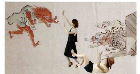
百鬼夜行図写真館の完成品サンプル

日時 7月15日(日)・22日(日)・8月5日(日) 13:00～16:00 場所 金剛館2階 *参加無料(入館料が必要)