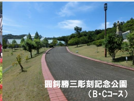
圓鑄勝三彫刻記念公園 (B・Cコース)