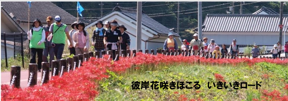
彼岸花咲きほこる いきいきロード