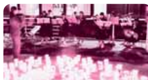
久保中学校(ブラスバンド部)

林芙美子像前 18:30～ 奄美三味線の演奏 19:30～ イリアンパイプスの演奏 尾道商業会議所記念館広場 18:30～ グループバンド「プレバラート」 19:30～ しまなみジュニアオーケストラの演奏 尾道郵便局前 18:00～ イリアンパイプスの演奏 19:00～ クラシックピアノソロの演奏 20:00～ クラシックピアノ&ヴァイオリンの演奏 ゆとりの広場 18:30～ しまなみジュニアオーケストラの演奏 19:30～ 奄美三味線の演奏 20:00～ グループバンド「プレバラート」