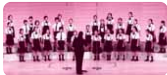
栗原小学校(コーラス部)

19:00～ コーラス部による合唱【栗原小学校】 ブラスバンド部による演奏【栗原小学校】