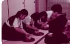
日比崎小学校(茶道クラブ)

18:30～ 古武道演武【尾道古武道保存会】 19:00～ フルートコンサート 【びんごフルートアンサンブル 崎谷 倫子】 曲目:小さな四季 他