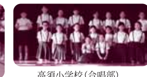
高須小学校(合唱部)