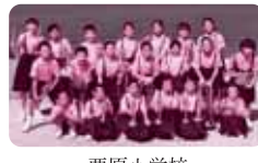
栗原小学校 (ブラスバンド部)