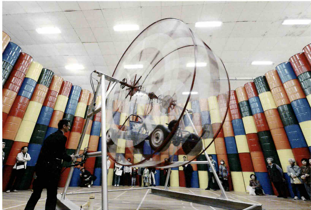
《Wandering Mickey》 ©YANAGI STUDIO

広島県尾道市の離島「百島」は戦後 3000 人と言われた人口が現在では 400 人弱と推測され、宿泊・飲食の施設がほぼない状況です。その百島で閉校となった旧中学校舎を活用して活動してきたアートベース百島は、このたび 47 年間空き家となっていた廃屋を再生し、アートとともに宿泊ができる「乙 1731-GOEMON HOUSE」として公開します。家の主人は挑発的なアートと特大の五右衛門風呂で、井戸から汲み上げられた水を鑄物の釜に溜めて薪で焚く単純な構造の五右衛門風呂は、ライフラインが切断された災害時でも入浴や炊出しに有用であることが東日本大震災を始め度重なる被災で証明されています。本展では「乙 1731-GOEMON HOUSE」を展覧会の主会場とし、宿泊施設として運用開始予定の来年夏に先駆けて、現代美術家・榎忠の過激な作品を母屋の大広間に展示、柳幸典の先鋭な新作は家の御神体として据えられます。そしてこの家の改修工事と五右衛門風呂の甕づくりは百島在住の職人集団「百島工房」がコラボレーションします。本展が現代のエネルギーの大量消費とその脆弱性を再考し、「生活=芸術」の形を思索する生存のための戦いの場となることを目指します。