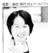
みつはら ゆり 光原百合

1957年、愛媛県生まれ。2006年、「るんびにの子供」で第一回「幽」怪談文学賞短編部門を受賞しデビュー。17年、『愚者の毒』で第70回日本推理作家協会賞長編部門を受賞。著書に『入らずの森』『角の生えた帽子』『死はすぐその影の中』『熟れた月』『骨を串う』『少女たちは夜歩く』など。