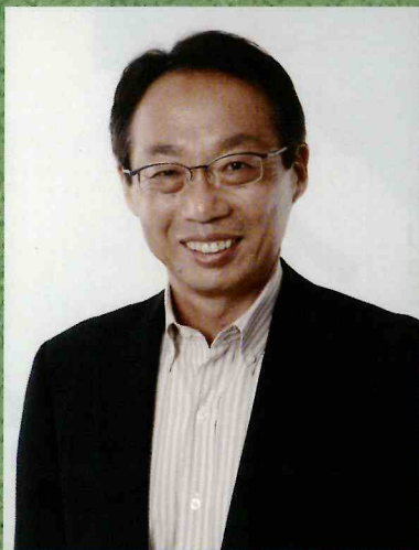
株式会社今治. 夢スポーツ代表取締役会長 元サッカー日本代表監督