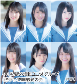
STU48課外活動ユニットグループ「勝手に!四国観光大使」