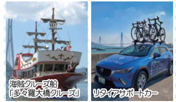
海賊クルーズ船「多々羅大橋クルーズ」