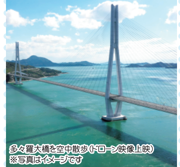
多々羅大橋を空中散歩(ドローン映像上映) ※写真はイメージです