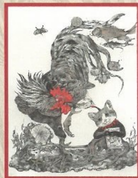
《ギュースターヴ若冲雄鶏図》2016年