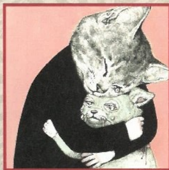
『ふたりのねこ』原画 2014年