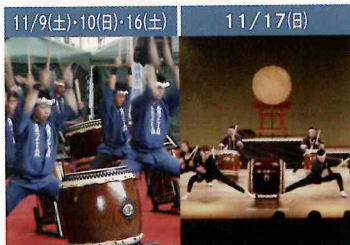
尾道 ベッチャー太鼓

尾道の深い歴史や仏教の世界... 副住職による特別講話で、心癒される! 地元グルメの「レモン鍋」に舌鼓!