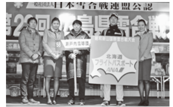
Pリーグ準優勝チームは、昭和南山国際雪合戦大会(北海道壮瞥町)へ！