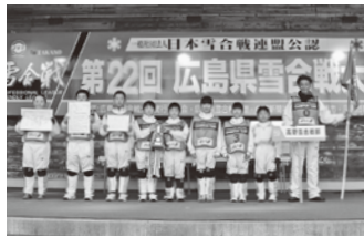
昨年度のジュニア優勝チーム