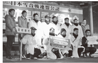
広島県大会の優勝チーム(Pリーグ及びレディースの部)は、日本雪合戦選手権大会(長野県白馬村)へ！