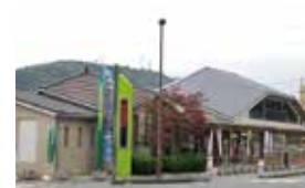
人と自然が輝く魅力あるまち いきいき・ふれあい交流ステーション

TEL/0848-77-0806 営業時間/9:00~18:00 定休日/12月31日、1月1日