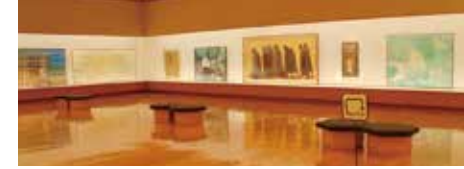
生口島出身の日本画家・平山郁夫の作品を展示。他ではなかなか見られない大下図(下絵)は必見。

TEL/0845-27-3800 営業時間/9:00~17:00 定休日/原則無休