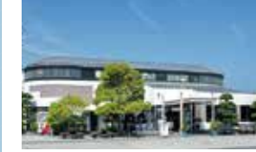
岩城島の特産品やお土産、島で採れた野菜や柑橘、卵、手作りリゾットなど島の食材がたくさん並ぶ直売所です。

TEL/0897-75-3277 営業時間/8:00~17:30 定休日/年末年始・地方祭日