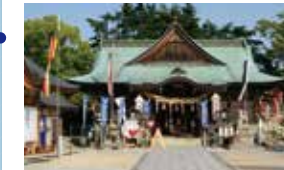
宝龜4年創立の因島最古とされる神社。自転車祈禱を行う「日本唯一の自転車神社」としても有名です。