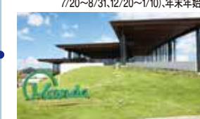
万田発酵が運営するサイクルオアシスにも指定されているHAKKO(発酵)が学べるテーマパーク。

TEL/0120-85-1589 営業時間/10:00~17:00 定休日/水曜日(右記期間は営業3/20~4/10 7/20~8/31,12/20~1/10),年末年始