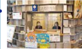
JR尾道駅構内にある観光案内所。「しまなみコース」制覇のプレゼント受け渡し場所です。

TEL/0848-20-0005 営業時間/9:00~18:00 定休日/12/29~12/31