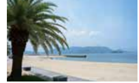
中国地方屈指の海水浴場がある海浜公園。ここで見る夕日は瀬戸内海でも有数の美しさです。