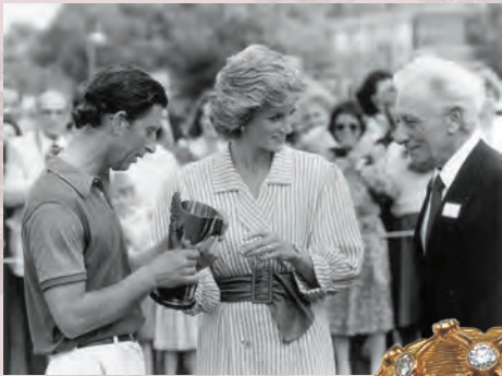
上 チャールズ皇太子と左手薬指にリングをつけるダイアナ元妃 右 ダイアナ元妃のダイヤモンドリング 1985年頃 フランス

ダイアナ元妃24歳の誕生日を記念してフランスの宝石商から贈られたリング。慈善事業に熱心なダイアナ元妃がチャリティオークションへ寄贈したものです。