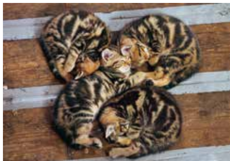
イングランド、プリストル