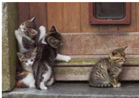
ベルギー、モンズ