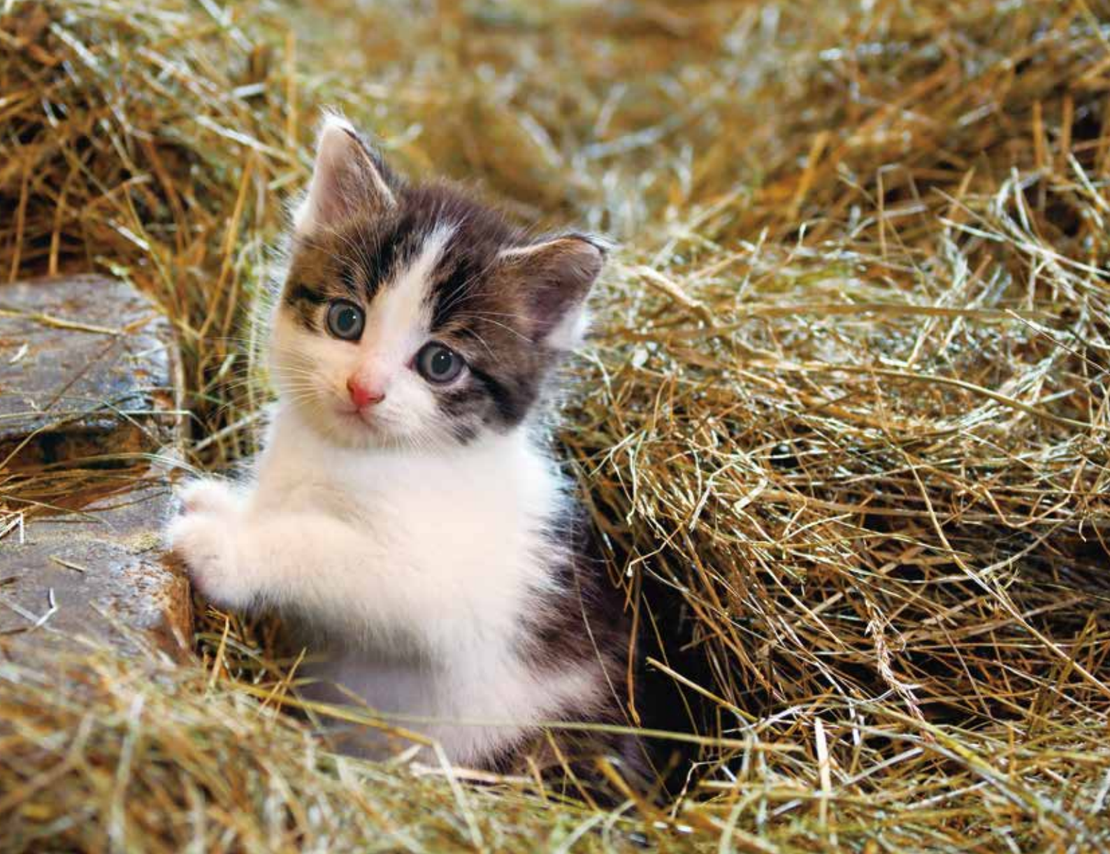
アイスランド、レイクホルト