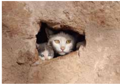
スペイン、バルセロナ