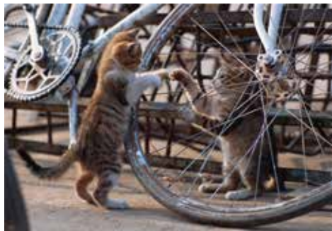
モロッコ、マラケシュ