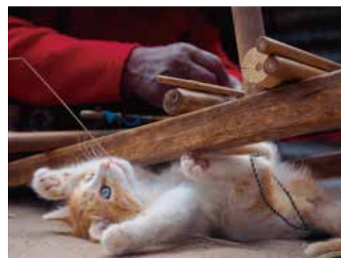
ペルー、タキーレ島

※中学生以下無料、前売りは各200円引 ※前売券販売所：中国新聞販売所（取り寄せ）、啓文社各店、JR尾道駅内観光案内所、生協ひろしま ※70歳以上、各種手帳（ミライロID可）をお持ちの方は証明できるものを提示により無料 主催：尾道市立美術館、中国新聞備後本社 企画制作：クレヴィス 後援：広島県、尾道エフエム放送、ちゅピCOM尾道、エフエムふくやま