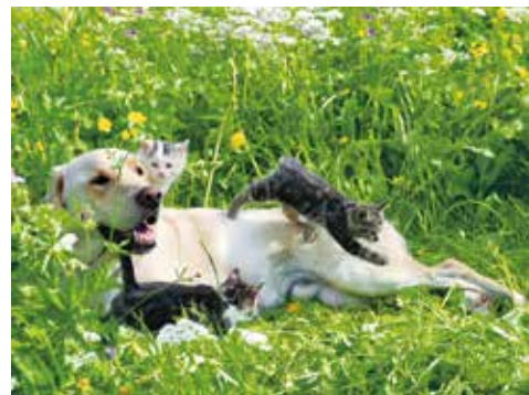
スイス、ヴェンゲン