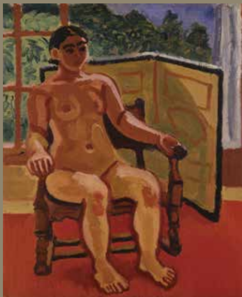
梅原 龍三郎「窓辺裸婦図」昭和8年(1933) 油彩