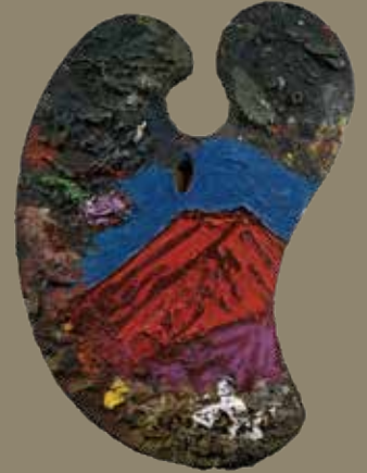
林 武「パレット」昭和42年(1967)