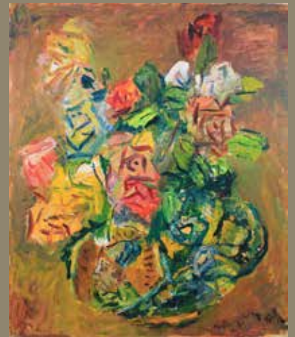
中川 一政「薔薇」昭和62年(1987) 油彩