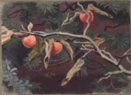
安井 曾太郎「実る梅」昭和12年(1937) 油彩

本展では、ピカソ、ユトリロなど海外作家に加えて、梅原龍三郎や安井曾太郎、林武など日本の巨匠たちのパレットと作品を展示、さらに当館所蔵の尾道市名誉市民の小林和作が使用したパレットと作品も加え、近代の巨匠たちの制作の秘密に迫ります。