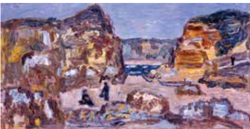
小林 和作「海辺の丘」昭和27年(1952) 油彩