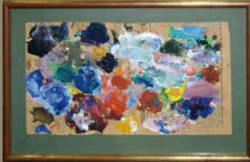
ラウル・デュフィ「パレット」1944年