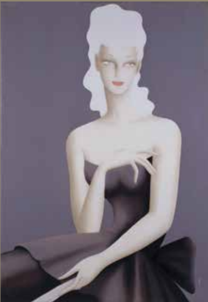
東郷 青児「ヴァイオレット」昭和24年(1949) 油彩 21023