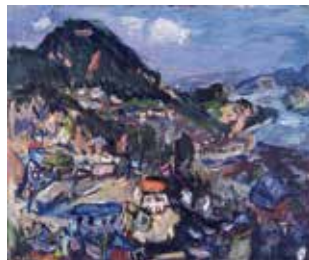
中川 一政「尾道風景」昭和36年(1961) 油彩