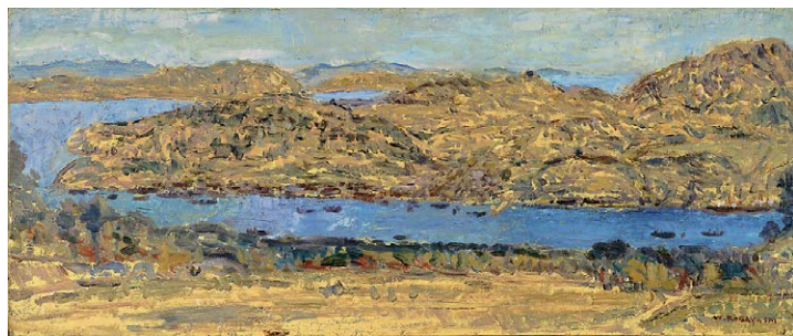
小林和作《尾道風景》昭和10年(1935)頃、油彩・カンヴァス