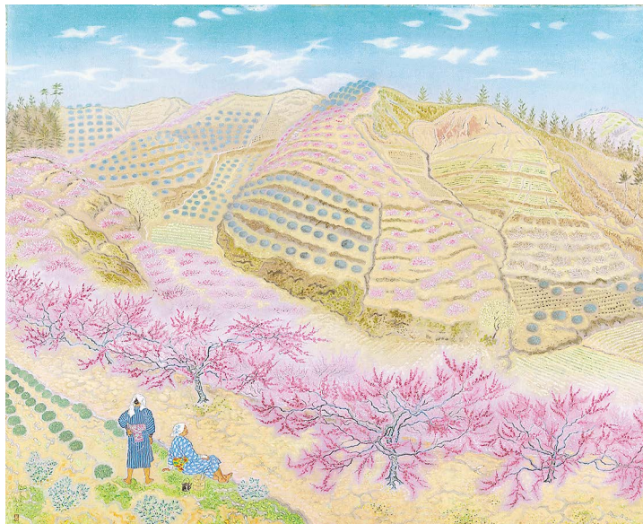
森谷南人子《桃花処々》昭和15年(1940)、紙本着色