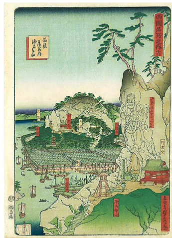
歌川貞秀《西国名所之内 十六 備後尾の道浄土寺山》