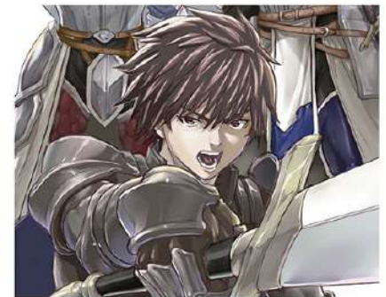
《『我が騎勇にふるえよ天地』5巻 表紙》