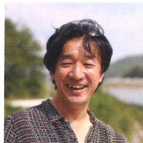
柳澤 潤 コンテンポラリーズ (向東認定こども園)