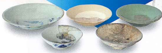
能島城出土貿易陶磁器（今治市村上水軍博物館保管）