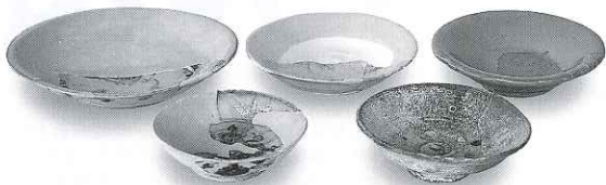
能島城出土貿易陶磁器 今治市村上水軍博物館保管