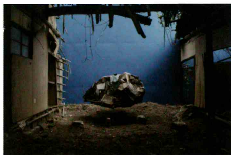
「Momoshima Wind-ow 迷子石」 2014