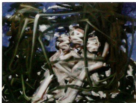
Photo by Keizo Kioku ©Toshiyuki Konishi, Courtesy of ANOMALY 2018 「無題」