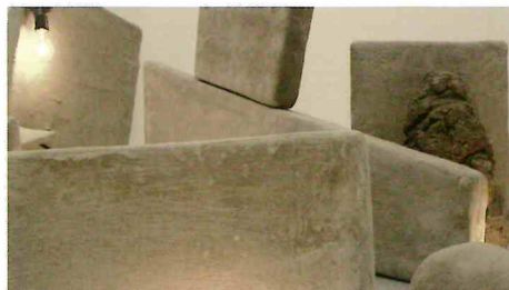
「道跡を建てる」ビデオスタイル 2018