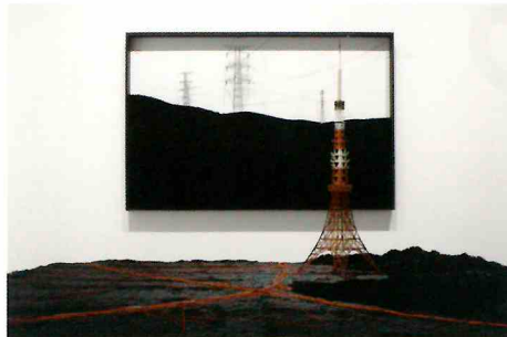
Photo by Keizo Kioku ©Takahiro Iwasaki, Courtesy of ANOMALY 2017 「ひかりは星からできている」展示風景